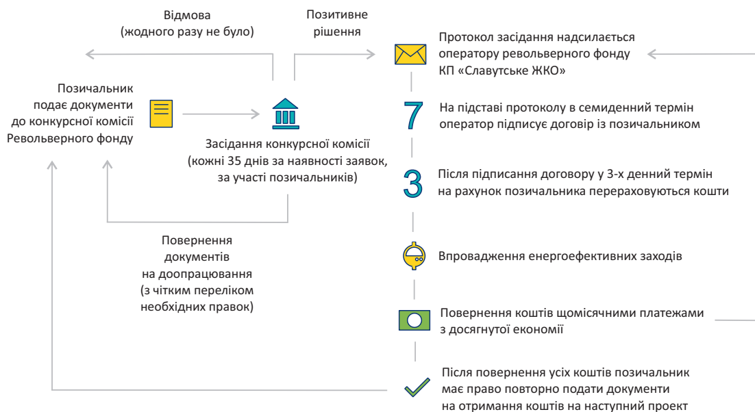
Схема роботи фонду:

Більш детальну інформацію можна отримати: